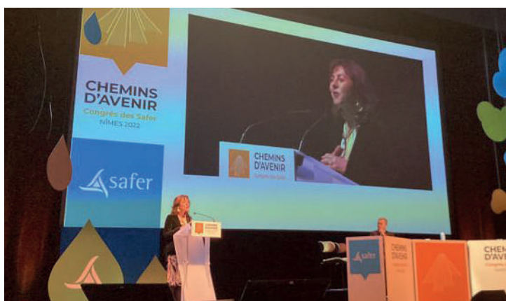
▲ Congrès des Safer, à Nîmes, les 7, 8 & 9 décembre 2022. Rapport d'orientation Safer/Environnement et intervention de Carole Delga, Présidente de la Région Occitanie.