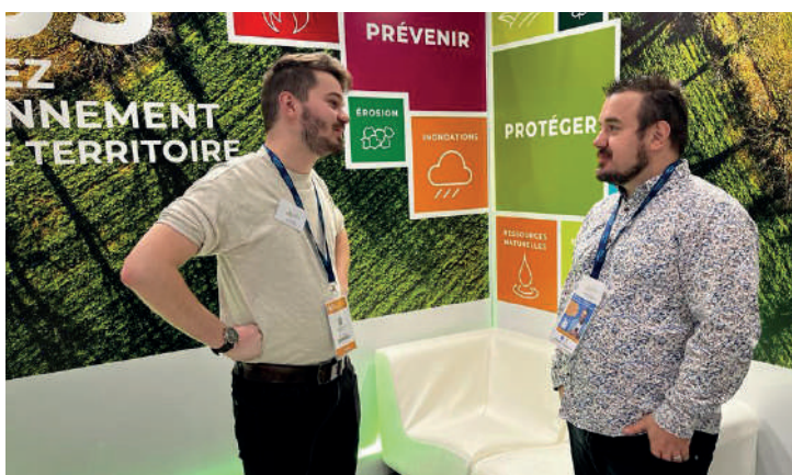
▲ Salon des maires et des collectivités locales, à Paris - Porte de Versailles, du 22 au 24 novembre 2022.